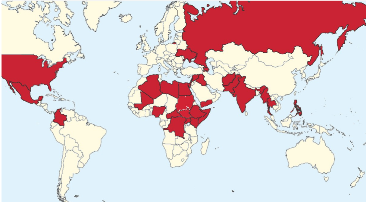
Mapa 1: Zaregistrované ozbrojené konflikty v krajinách sveta v roku 2014